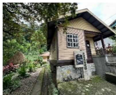
投降の地(小学校敷地内の資料館・平和博物館)